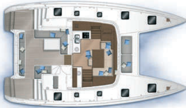
Carré et cockpit / Saloon and cockpit