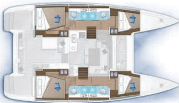
4 cabines, 4 salles d'eau / 4 cabins, 4 bathrooms