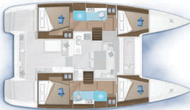
4 cabines, 2 salles d'eau / 4 cabins, 2 bathrooms