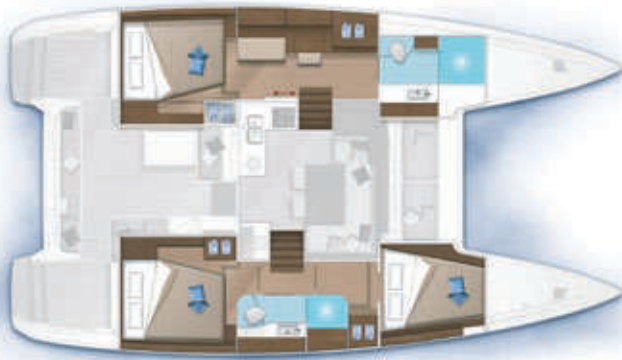
3 cabines, 2 salles d'eau / 3 cabins, 2 bathrooms