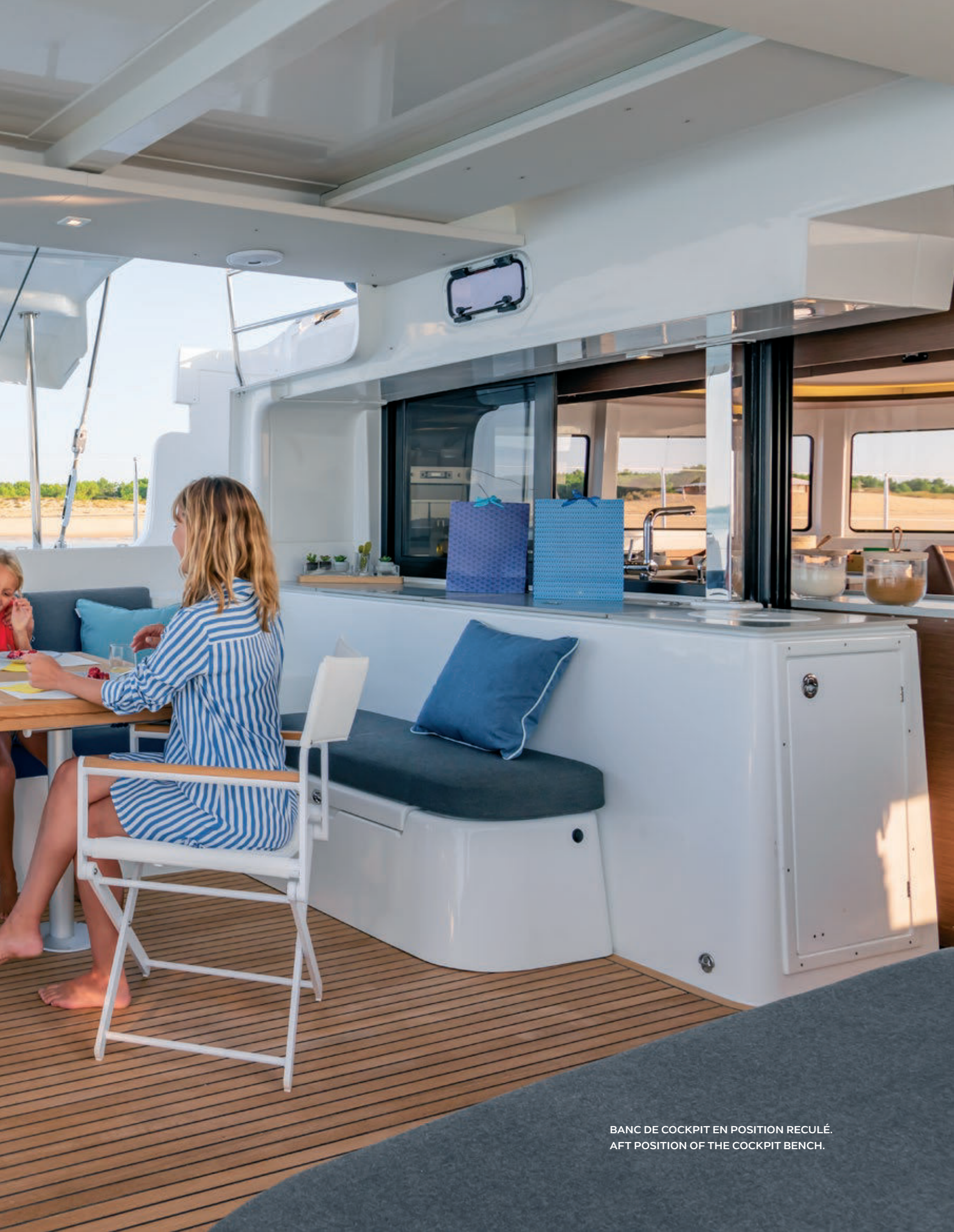
BANC DE COCKPIT EN POSITION REULÉ. AFT POSITION OF THE COCKPIT BENCH.