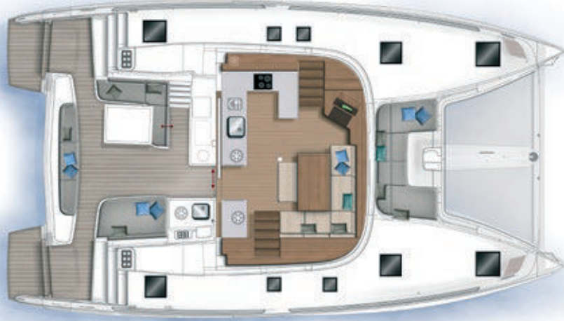
Carré et cockpit / Saloon and cockpit