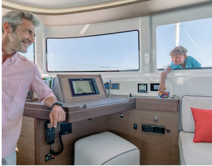
VITRAGE COULISSANT OUVERT. SLIDING SASH WINDOW OPENED.