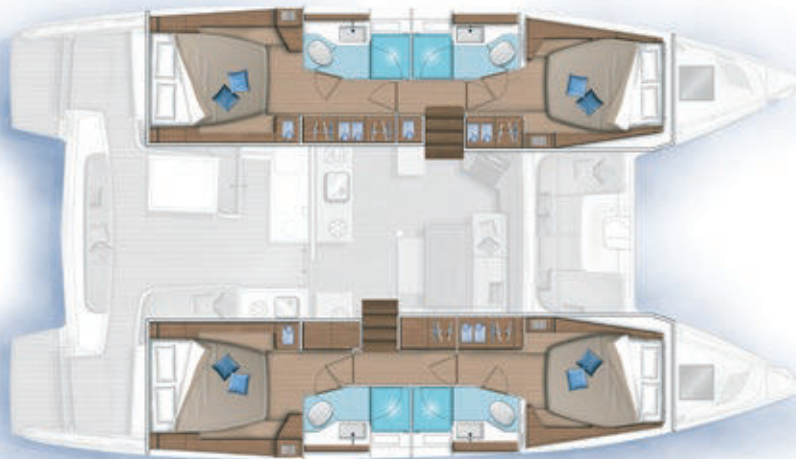
4 cabines, 4 salles d'eau / 4 cabins, 4 bathrooms